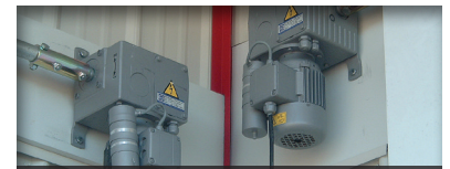
Réducteur pour arbre d'entraînement