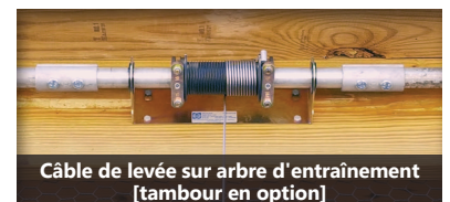
Câble de levée sur arbre d'entraînement [tambour en option]